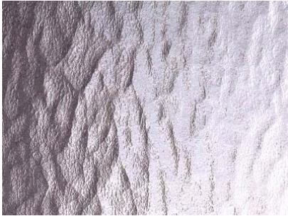
Katedral 4 mm ofärgat/färgat