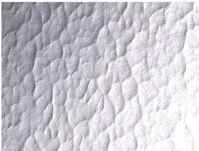
Franskt Katedral 4 mm ofärgat