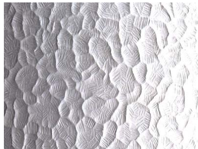
Pensé 4 mm ofärgat