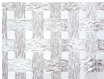
Twist 4 mm ofärgat/färgat