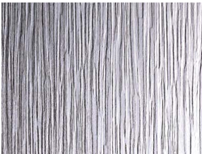
Cotswold 4 mm ofärgat