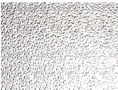
Lava 4 mm ofärgat