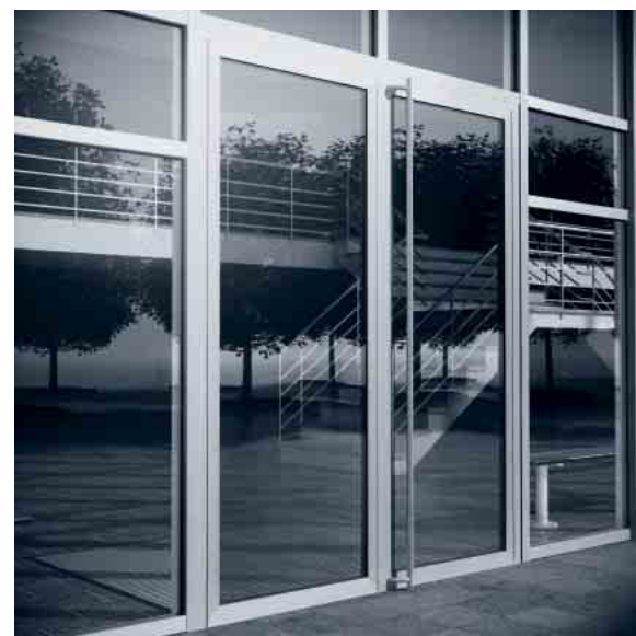
Schüco Tür ADS 75.SI HD Schüco Door ADS 75.SI HD