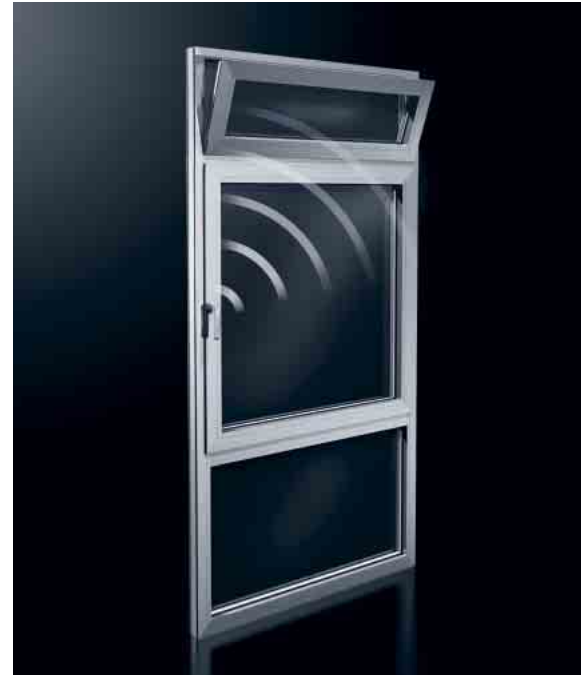
Schüco AvanTec Funkgriff: komfortable Oberlicht-Bedienung Schüco AvanTec radio-controlled handle: Convenient toplight operation